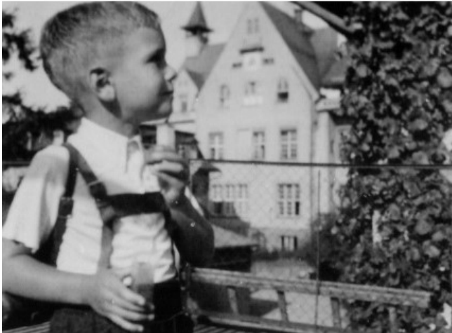
Ich im Alter von 6 Jahren und mein Vater als Fahnenträger der deutschen Turner bei den Olympischen Spielen 1936 in Berlin

Schlimm war für mich der Winter im ersten Jahr in Lindenberg. In Ermangelung von normaler Kinderkleidung musste ich auch bei viel Schnee kurze Hosen mit langen Wollstrümpfen tragen, die mit „Weiber-Strapsen“ festgehalten wurden. Nach zwei Jahren ohne Mutter hatte ich dann große Probleme mit meinem Vater, vor allem, als wir dann eine Stiefmutter bekamen, die zwei Kinder mit in die neue Ehe brachte. Es kamen dann noch drei Kinder dazu und wir waren dann elf Personen im Haushalt. Mein Vater war autoritär und die neue Mutter sehr dominant. Mein Vater verweigerte mir Antworten auf seine Vergangenheit in Bezug auf den Krieg und erst viel später sah ich ein Foto mit ihm als Nazi-Fahnenträger bei der Olympiade 1936 in Berlin, wo er Sport studiert hatte.