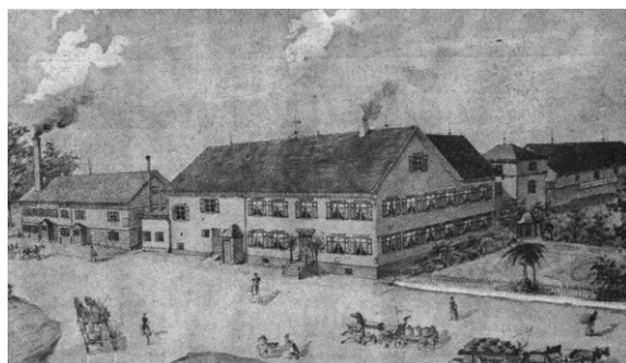
Dasselbe Haus in einer anderen Perspektive, beide Aufnahmen aus den Jahren 1893/94.