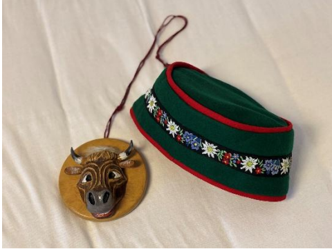
Käsmolle Orden und Mütze

Ich war in Scheidegg bei der Narrenzunft Isbäria 28 Jahre Umzugspolizist mit einem großen Kopf aus Pappmaschee. Zum Umzug haben sich die Narren unten am Bahnhof (jetzt Edeka) gesammelt, da bin ich gestanden mit einer Pistole, um halb zwei hab ich geschossen, dann ist es die Bahnhofstraße rauf gegangen, in die Kirchgasse rein, rauf in die Blasenbergstraße, runter in die Luitpoldstraße zum Kurhaus. Zuerst war das Anschießen und dann das Mitlaufen vorne her, den Zug mitziehen, das waren etwa 3500 Narren. Die Scheidegger machen das bis heute.